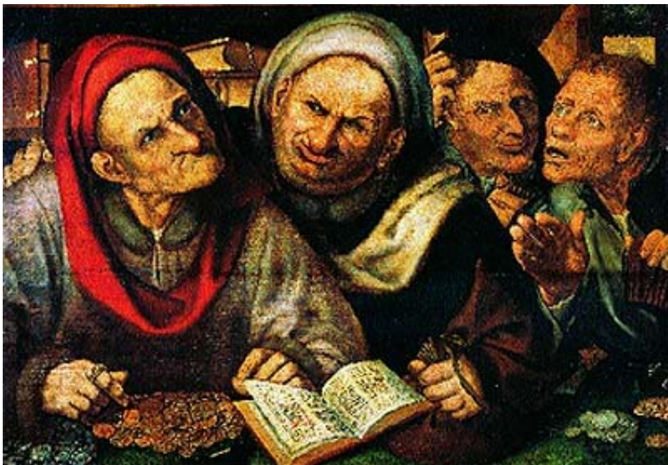
Quentin Metsys "Gli usurari"