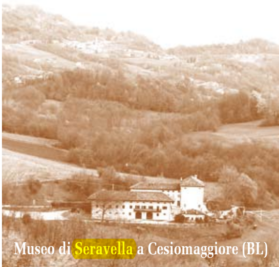
Museo di Seravella a Cesimaggiore (BL)